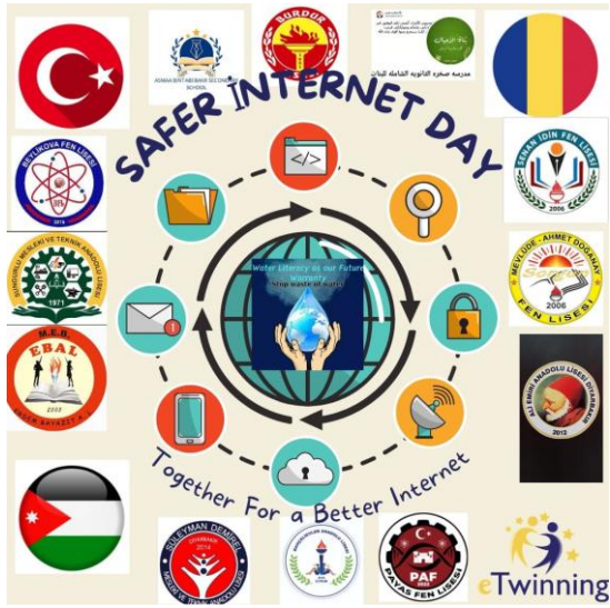
TÜM OKULLARIN OKUL LOGOLARI (13 ADET)