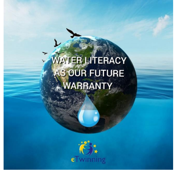
OKUL PROJE LOGOSU